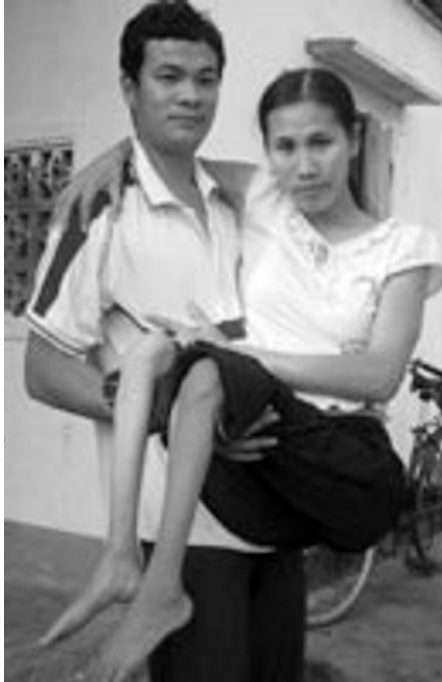
(Đôi vợ chồng 25 tuổi đầy hạnh phúc dưới chân núi Đồi)

Trong đời sống chỉ có vợ chồng là những người gần gũi nhau nhất, thường bên nhau chia sẻ những cay đắng ngọt bùi, khi đói khát cũng đồng cam cộng khổ chia nhau; lúc đau ốm thì đồng nuôi nhau. Cuộc đời này không có ai bằng vợ và chồng, vậy có sao lại nữ lòng đánh vợ, chửi chồng, v.v...!?